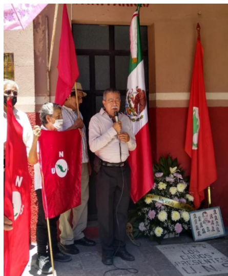
Ante la placa en honor a nuestros caídos el Jefe Nacional dirige un mensaje.

de compañeros y simpatizantes del bonito León Gto., Querétaro, San Luis Potosí y por supuesto, de Celaya, región generosa, brava y heroica, que fue alborada de