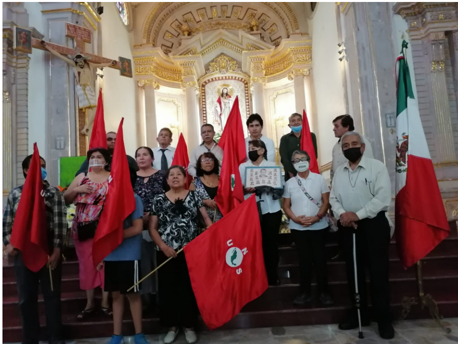
Al concluir la celebración eucarística en honor a nuestros caídos en la catedral de Celaya, el Jefe Nacional conduce el Canto de Lucha y el Saludo Sinarquista.

Durante nuestra estadía en Celaya y después de la celebración eucarística, nos dirigimos con el debido respeto al lugar donde yace una placa en su memoria para brindar honores a nuestros compañeros que ofrendaron su sangre y vida por el reclamo democrático de "Libertad de reunión" y el "Pendón de la Patria".