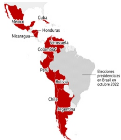
>residente electo de Colombia asume en agosto 2022

Los seglares que optaron por éste tipo de regímenes, ¿pertenecen a la Iglesia