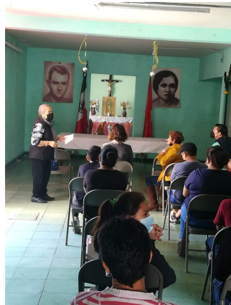
Reunión General del Comité Municipal de León el 12 de diciembre.