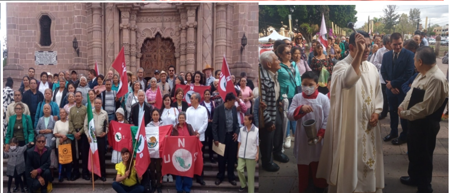
Nuestra Celebración Eucarística en el santuario de nuestra Sra. De Guadalupe