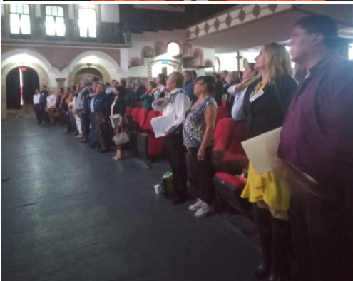
LII Asamblea Nacional Sinarquista